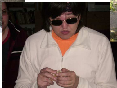
na besedě pozorně posloucháme a prohlížíme rukama