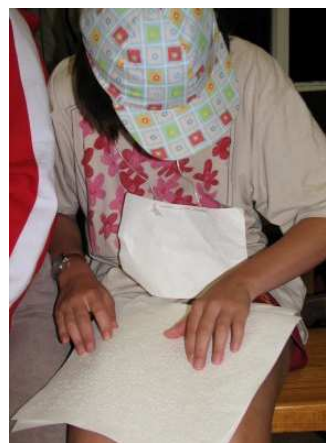
bez „braila“ to nejde ani na táboře (letní tábor 2008)