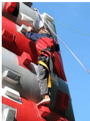
nic není nemožné, jen chtít (letní tábor 2008)