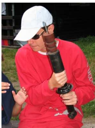
prohlížíme rukama (letní tábor 2008)