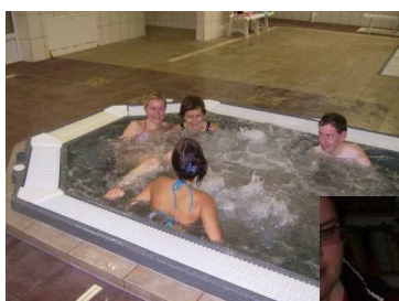
v relaxačním bazénu