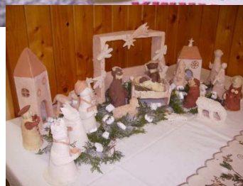
Vánoce v TyfloCentru