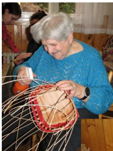
Velikonoce v TyfloCentru