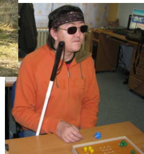
hry přizpůsobené vnímání nevidomých